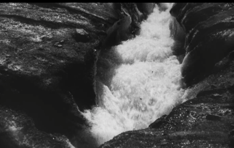
PROGRAMME DE TROIS COURTS MÉTRAGES ALDÉBARAN D'EMMA DANION / REWIND D'ARIANE MICHEL UNDER THE LAKE DE THANASIS TROUBOUKIS