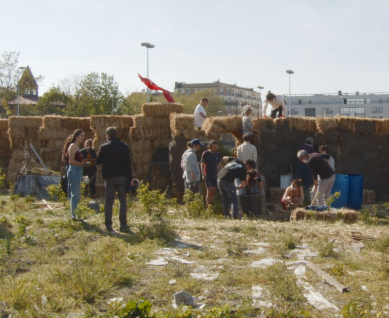
LE TERRE DES VERTUS DE VINCENT LAPIZE