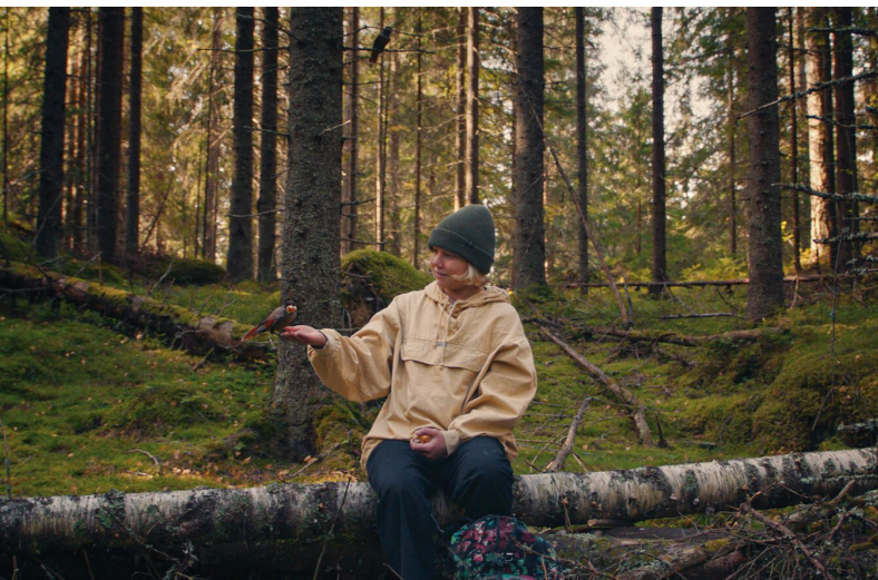
ONCE UPON A TIME IN A FOREST DE VIRPI SUUTARI