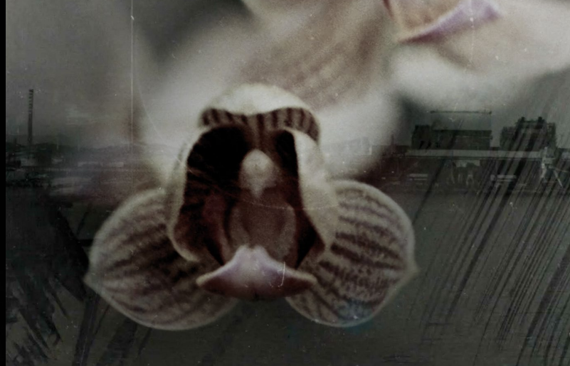
HORKOS DE MARTA ANATRA