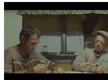
LE SENS DE LA TERRE