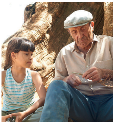
L'Olivier de Iciar Bollain

Ciné conférence de Thierry Paquot , philosophe de l'urbain, à partir d'une douzaine de films sélectionnés par Image de ville pour des débats publics dans les communes et dans les établissements scolaires.