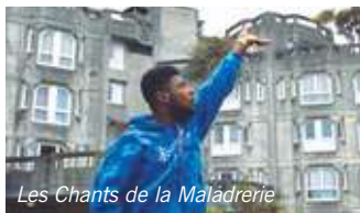
Les Chants de la Madrerie

Cette édition 2017 inaugure, avec l'Institut de l'image / Pôle régional d'éducation artistique au cinéma, un rendez-vous annuel dédié à la production régionale de films d'ateliers sur l'architecture et l'espace urbain.