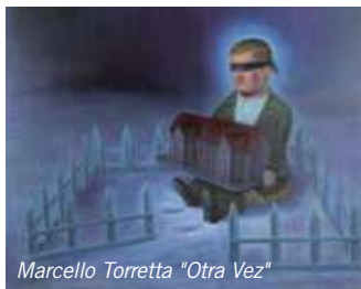
Marcello Torretta "Otra Vez"

Conçue par l'artiste Gustavo Giacosa , l'exposition La Maison invite à une exploration poétique de ce lieu familial, à partir d'œuvres d'art brut et d'art contemporain. Le festival propose une table ronde-projection avec Gustavo Giacosa , et l'historien de l'art Marc Decimo .