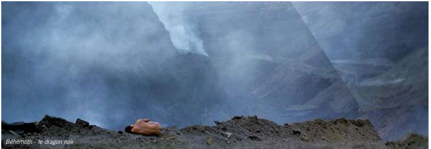
Béhémoth - le dragon noir