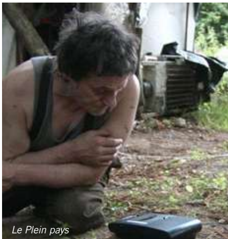
Le Plein pays