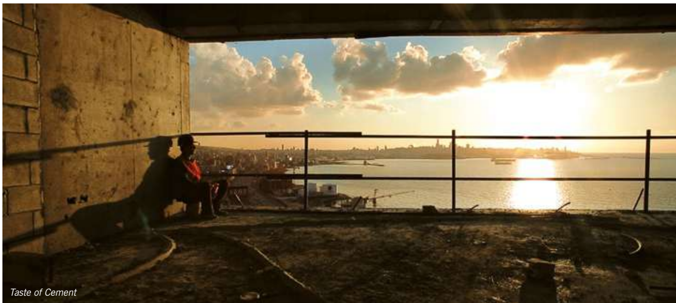
Taste of Cement