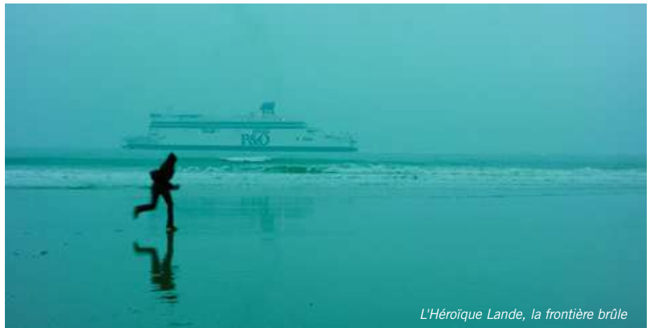
L'Héroïque Lande, la frontière brûlée