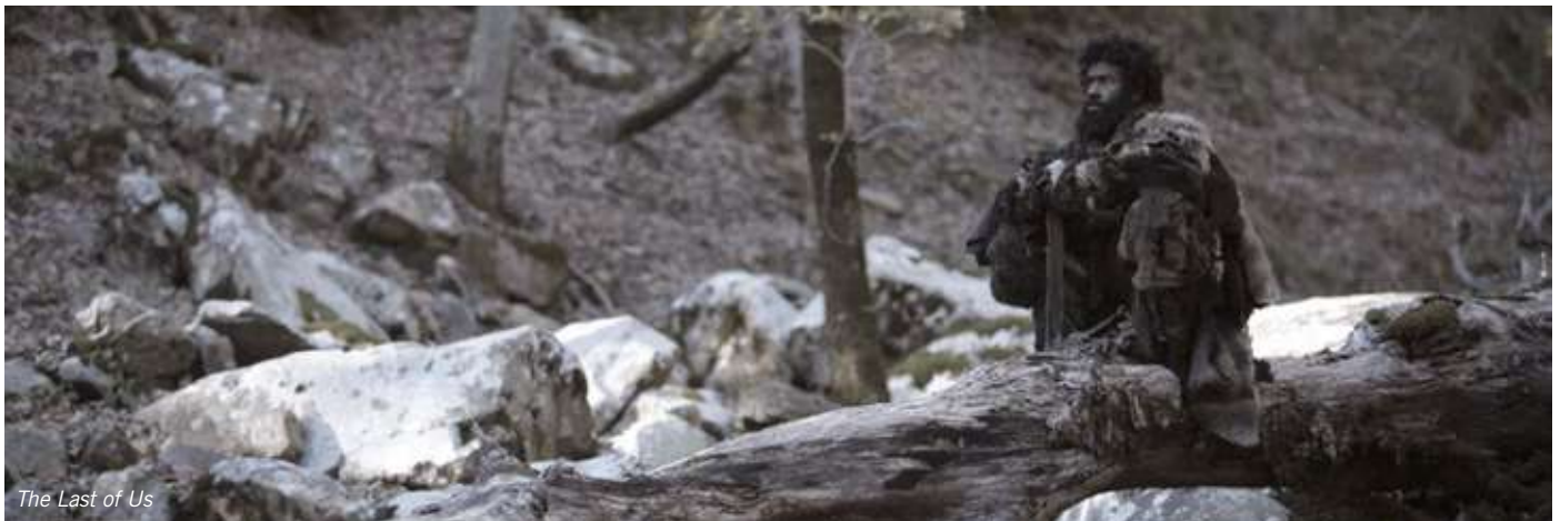
The Last of Us