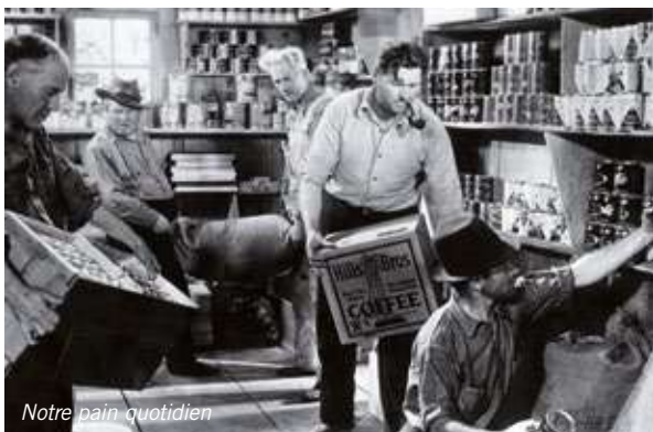
Notre pain quotidien