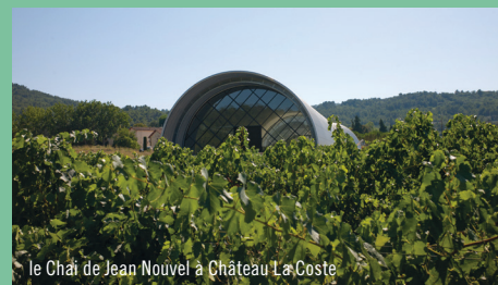
le Chai de Jean Nouvel à Château La Coste