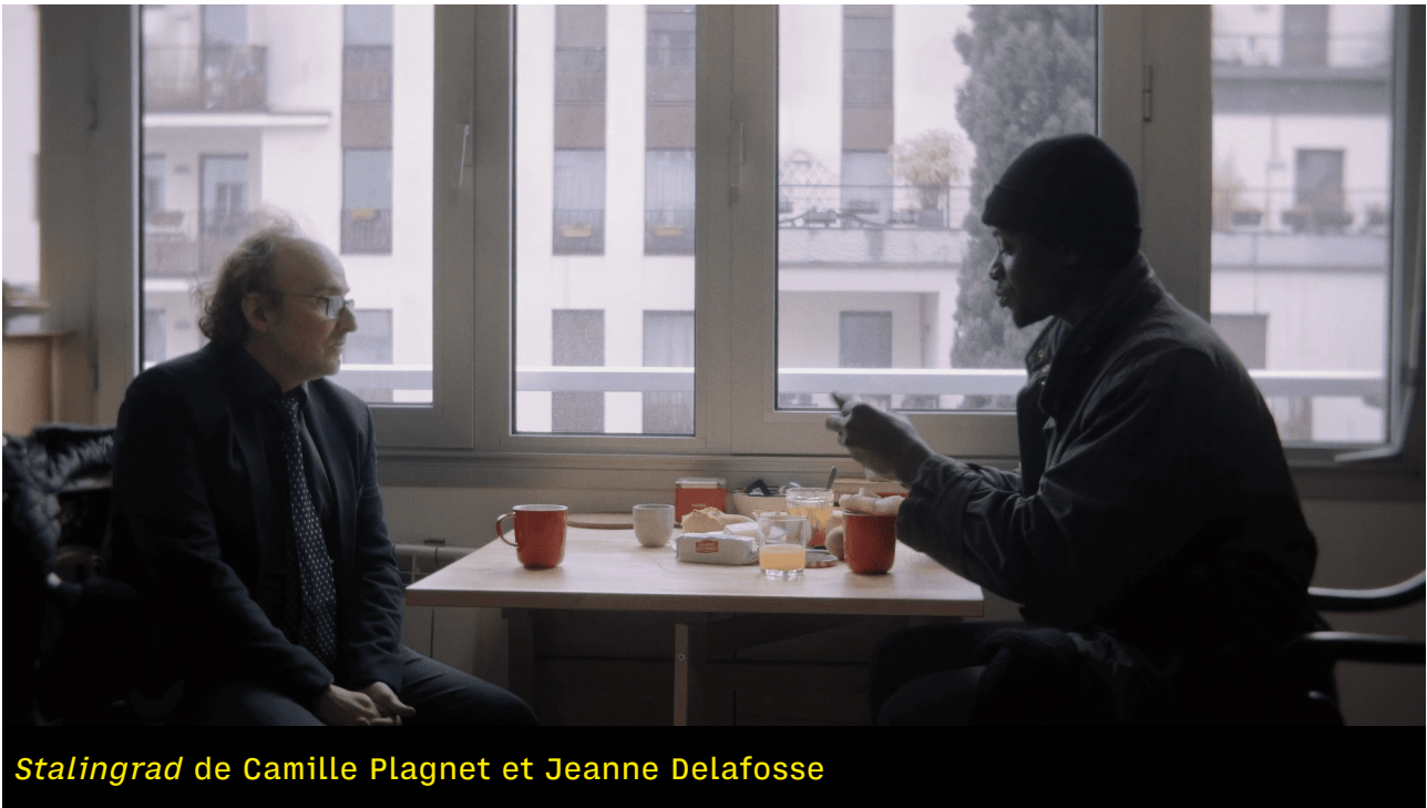
Stalingrad de Camille Plagnet et Jeanne Delafosse