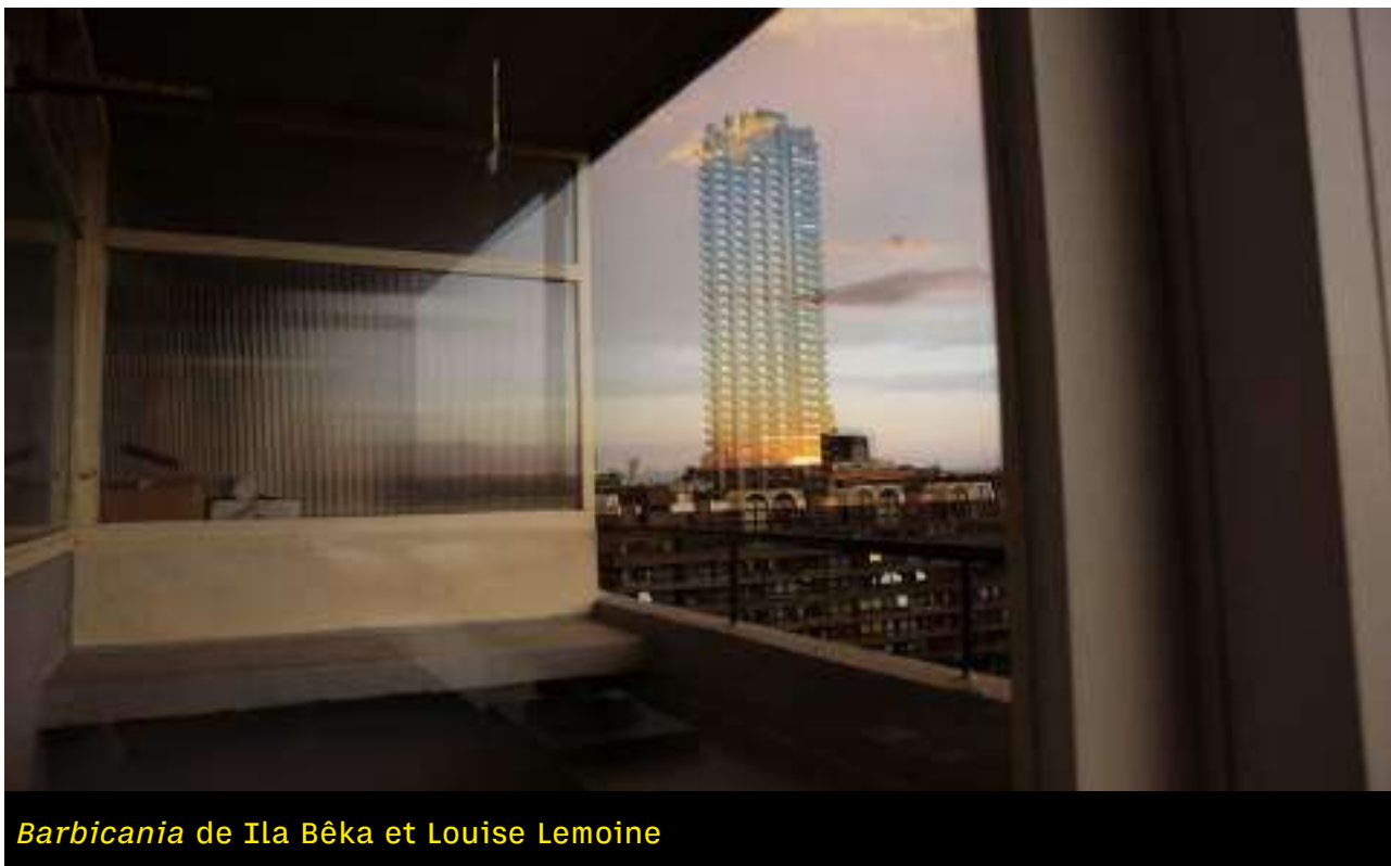
Barbicania de Ila Bêka et Louise Lemoine

Samedi 17 octobre - 14h - Le Miroir, Centre de La Vieille Charité, Marseille