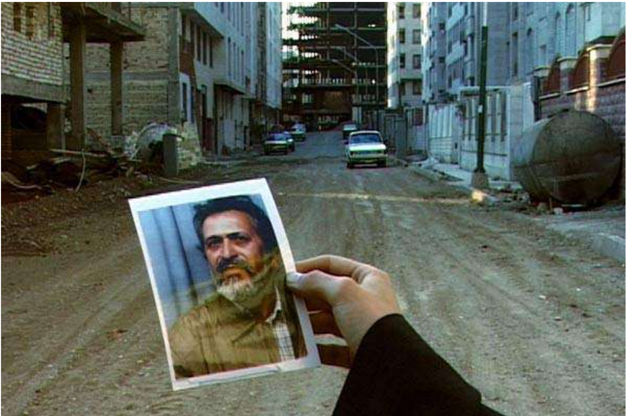
Le voyage de Maryam de Sepideh Farsi

Projection - jeune public (à partir de 9 ans)