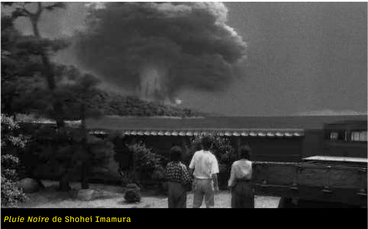
Pluie Noire de Shohei Imamura

suivie d'une rencontre avec Alfonso Pinto