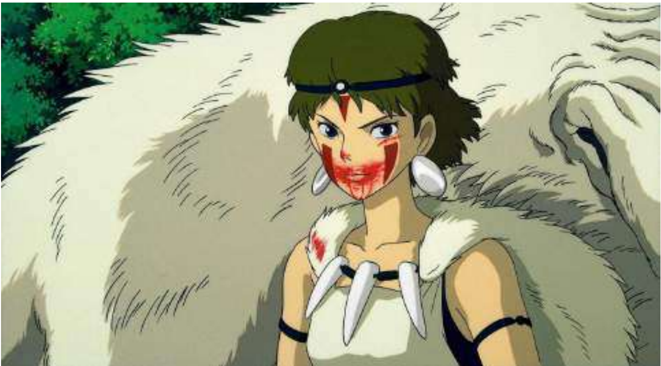
Princesse Mononoké de Hayao Miyazaki