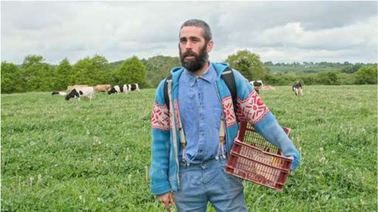
Autonomes de François Bégaudeau