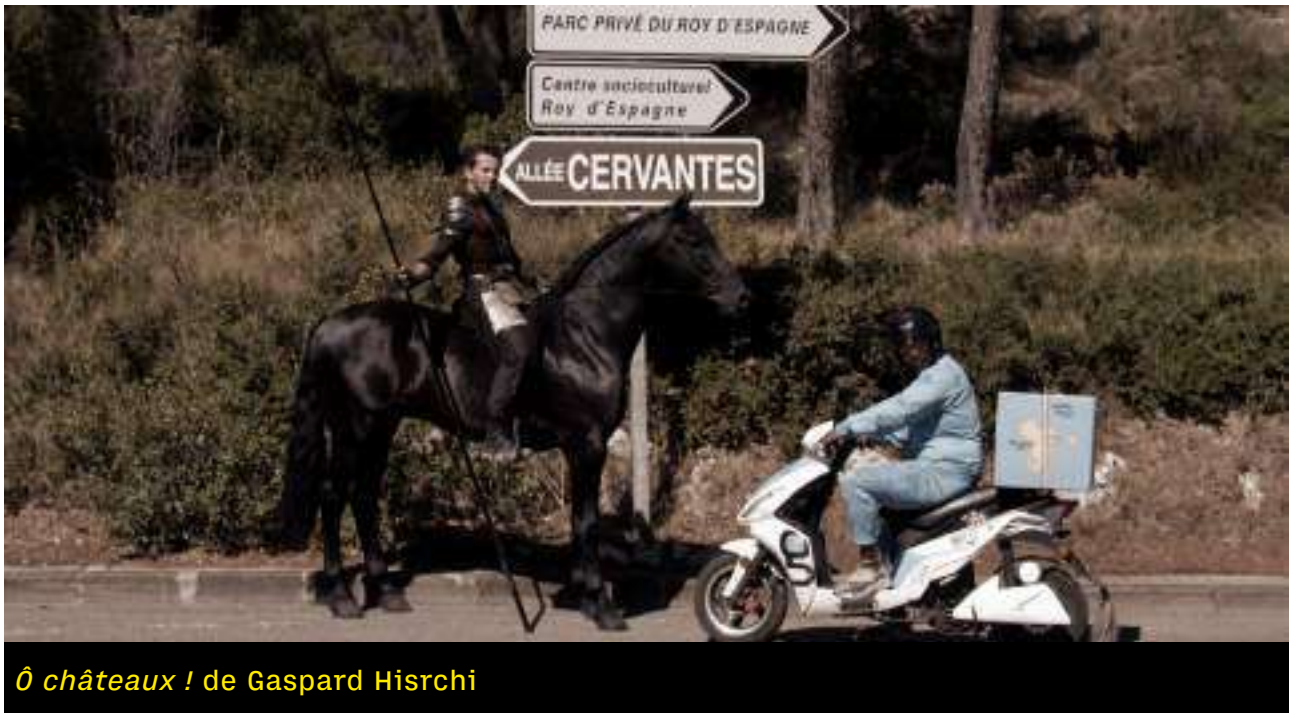
Ô châteaux ! de Gaspard Hirschi

présentation - film en chantier / film produit en Région