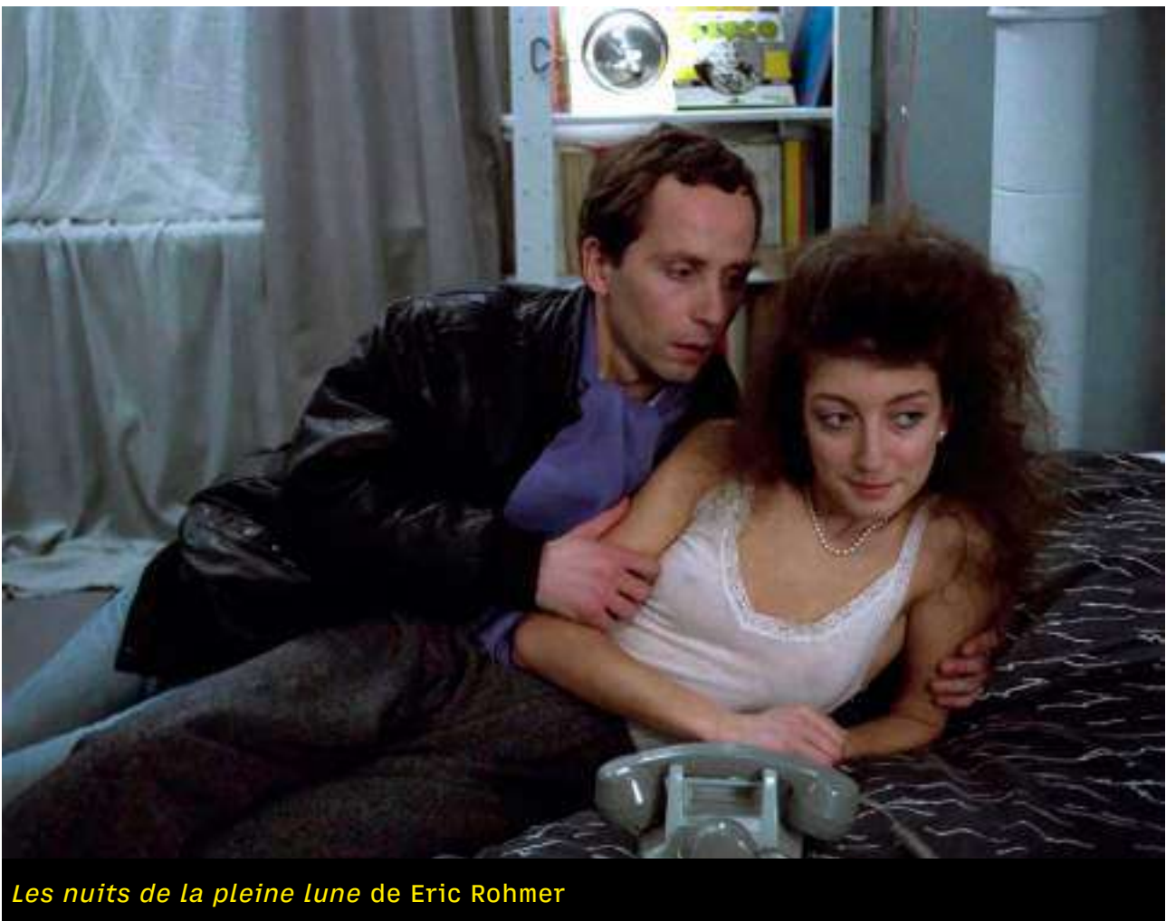
Les nuits de la pleine lune de Eric Rohmer