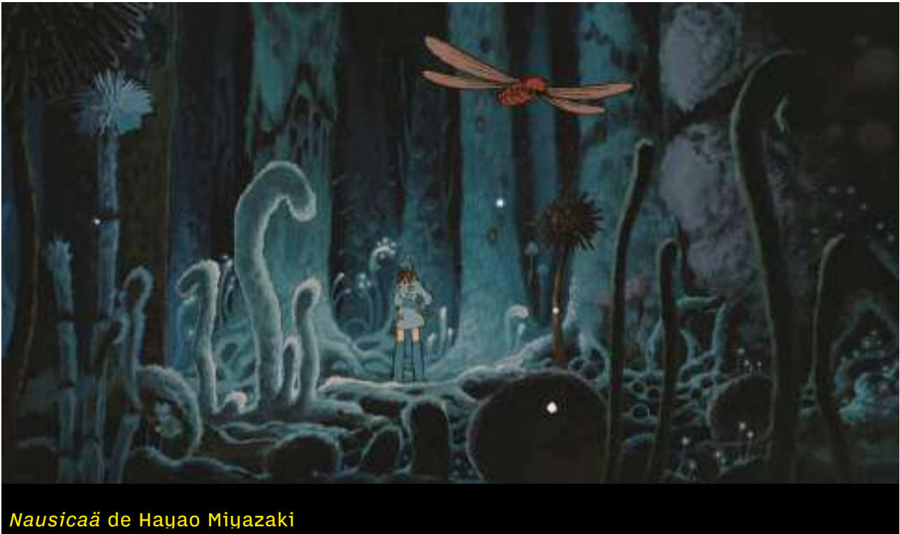
Nausicaä de Hayao Miyazaki