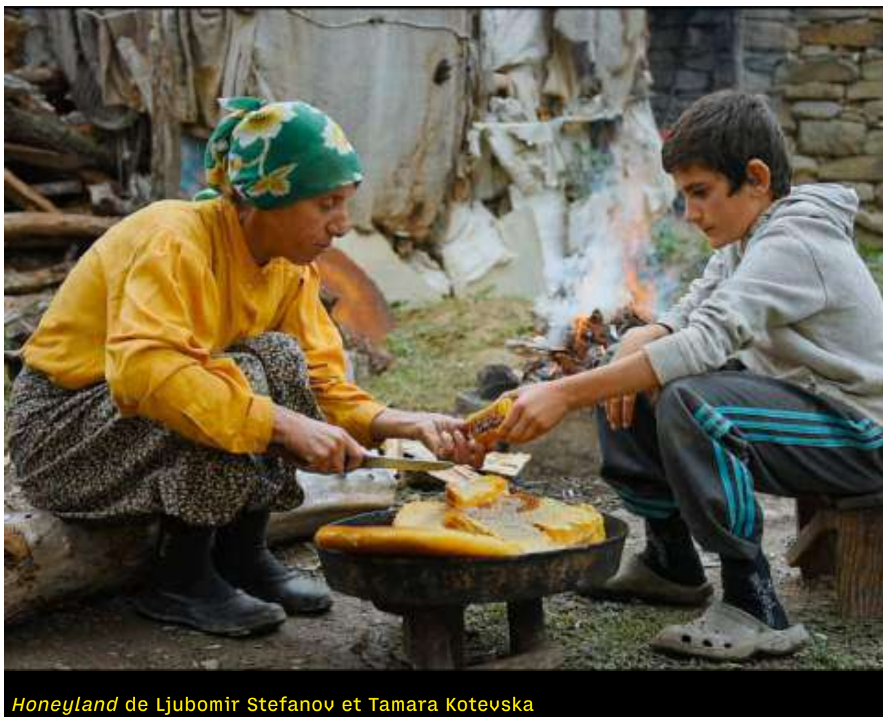
Honeyland de Ljubomir Stefanov et Tamara Kotevska

Jeudi 15 octobre - 20h - Le Cube / Théâtre Vitez