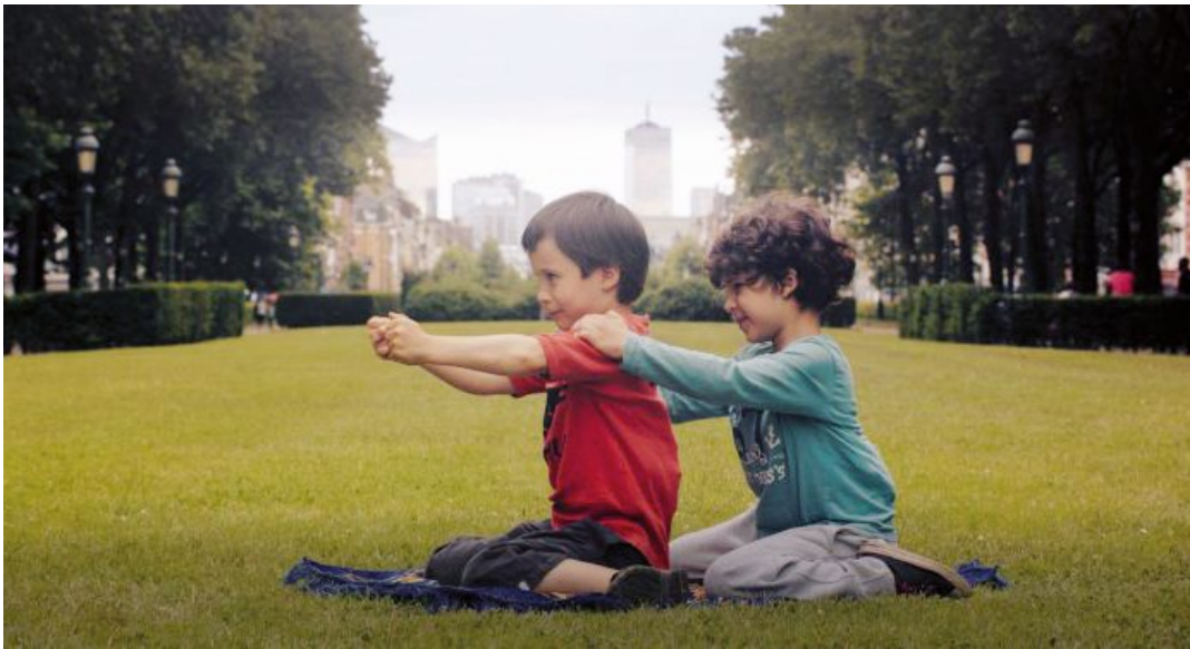
Gods of Molenbeek de Reetta Huhtanen