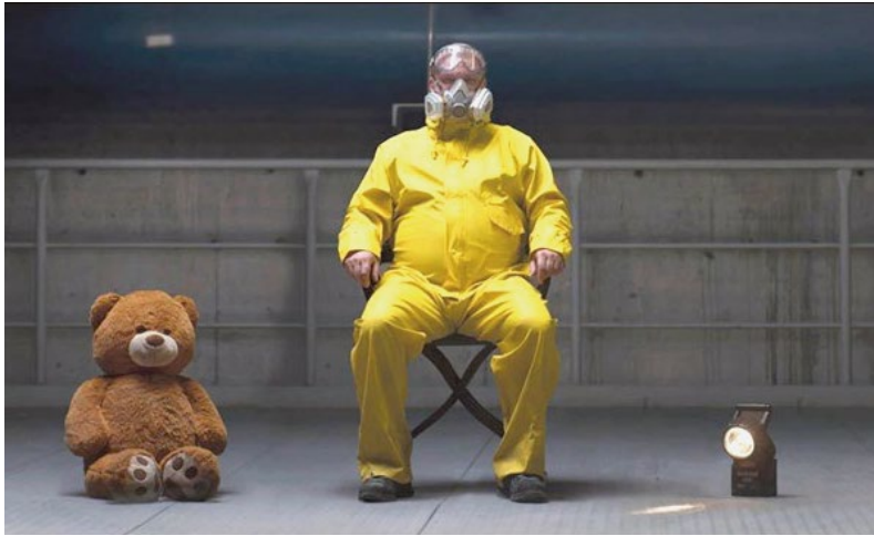
Beautiful Things de Giorgio Ferrero et Federico Biasin