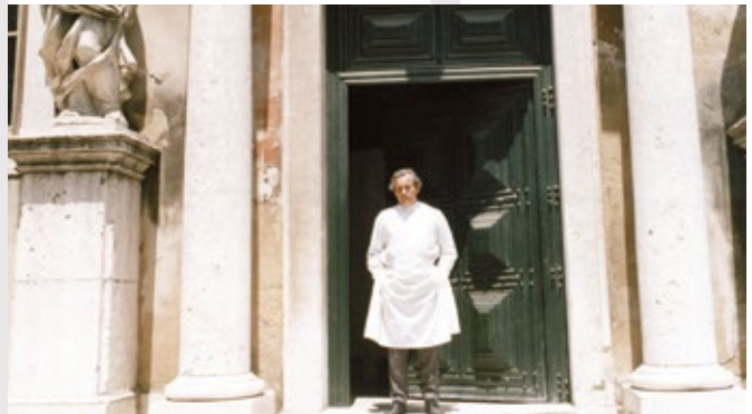
Doc's Kingdom de Robert Kramer