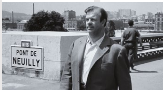
Le Signe du Lion d'Eric Rohmer