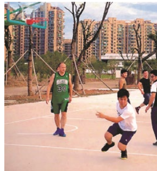
Archi-Faux de Benoît Felici