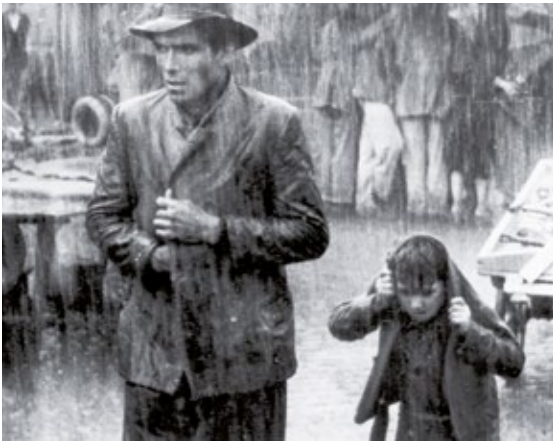
Le Voleur de bicyclette de Vittorio De Sica